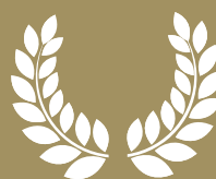
EDISON SONDERPREIS „SOCIAL ENTREPRENEURSHIP“ 1.500,-